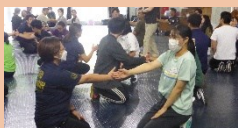
第8回 レクリエーション等 首里公民館 7/31