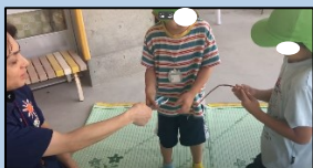
検証保育 7/1（城南こども園）