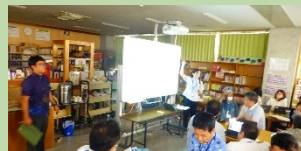
情報教育講座Ⅱ（学校ポータルサイト） 真和志中学校図書室 6/26