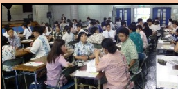
第7回 小中一貫教育等 首里公民館 7/4