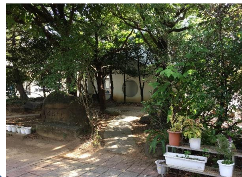
②「はばたけ」の石碑の小路に入る