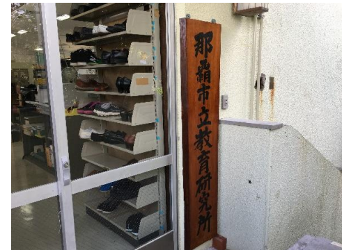
④2階に入り口があります

※研究所専用の駐車場は 学校敷地内にはありません。 来所の際には、公共交通機関等 を利用して下さい。