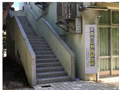
③小路を抜け階段を上る