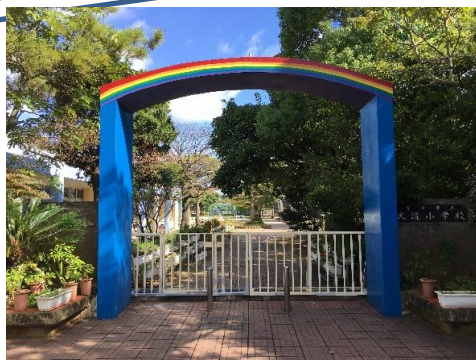
①真和志中向かいの正門が入り口

移転先!! 大道小学校内 (栄町通り沿い校舎2階・真和志中学校向かいの正門が入口です)