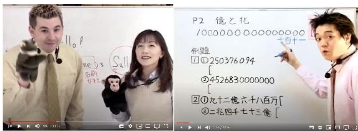
[キッズトーク5分] レッスン1

https://www.youtube.com/watch?v=gJyKzS2MjTA&feature=youtu.be