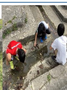
6年生 平和祈念公園