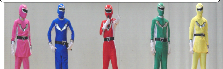
ももいろ(夢ちゃん) あお(城くん) あか(城北レッド) みどり(こころちゃん) きいろ(ちいちゃん)