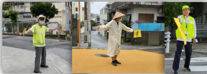
いつもありがとうございます。裏面にスクールガード皆さんを紹介しています

子どもたちが安全に安心して登校できるようにと、学校あるいは途中まで、お子さんやお孫さんに付き添う様子が見られました。学校周辺の信号のない交差点などでは「城北小スクールガード」の皆さんが交通安全誘導をいただいている様子も見られました。裏面で毎朝交通安全立哨活動をしている皆さんを紹介しています。皆さんの名前を呼んで「〇〇さんおはようございます。」「〇〇さんありがとうございます。」と言えるといいですね。