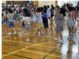
元気なダンスを披露しました

1年生は、入学して約1ヶ月が過ぎ、学校生活にも慣れてきたことと思います。楽しいこといっぱいの城北小学校をもっともっと好きになってくれたらいいなと思います。