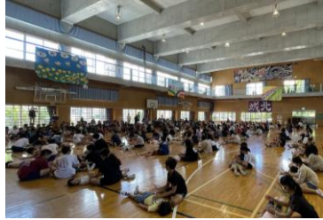
6年生とふれあい遊び「おいものてんぷら」