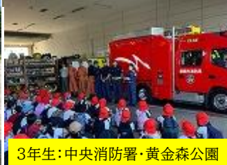
3年生:中央消防署・黄金森公園