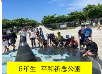
6年生 平和祈念公園