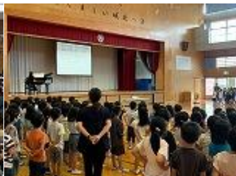
全校平和集会で歌う様子