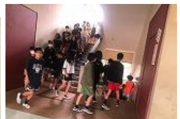
経路を確認して避難する児童