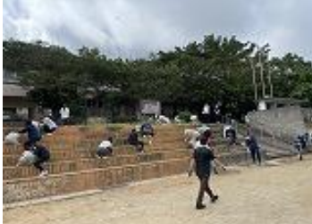
スタンドの除草作業