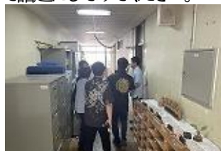
不審者を隅へ追い込む職員

6月7日(金)不審者侵入を想定した全校避難訓練を実施しました。当日は、校内に侵入した不審者が1つの教室にやってくる想定で訓練を行いました。本校では、複数の避難経路が確保されていますが、とくに不審者侵入ときには、鍵のかかる教室は鍵をかけ部屋で待機、それ以外は、放送等の指示に従い、侵入個所に近づかない経路を選んで避難します。同時に、職員は侵入者に、さす股などを持って対峙し校内の隅に追いやるなどして子供たちから遠ざける訓練をしました。学校においても、授業中だけでなく、休み時間など、近くに教師がいない場面で避難が必要になることも考えられます。そのようなときでも訓練等で経験したことを踏まえ、しっかりと行動できるよう、指導していきます。各家庭においても、学校外で避難が必要な場面などを想定し、状況に応じた避難の仕方について話題してみてください。