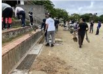
側溝の蓋を開けて溝さらい

6月8日(土)に第1回PTA作業が行われました。当日は早朝より多くの方々に参加いただき大変うれしく思いました。梅雨時期ということもあり、天気が心配されましたが、作業時間中は、雨が降ることもなく、予定していた運動場の溝さらい、農具小屋の整理の他、運動場周辺の除草等も行うことができました。また、当日参加できなかった城北マリナーズ(野球)の保護者、児童が16日(日)に運動場周辺の除草作業に取り組み、とてもきれいになりました。感謝です。