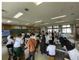
小中合同授業研究会