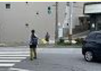
スクールゾーン立証の保護者の様子 ありがとうございます