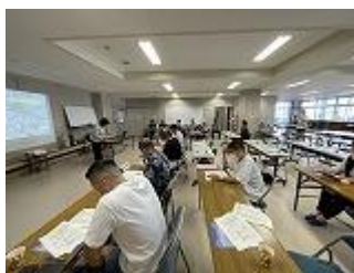
小中一貫全体会議の様子

5月の学校だよりの中で、本校では今年度から学校運営協議会制度(コミュニティスクール)がスタートしていることを紹介しました。那覇市では、これまでの小中一貫教育のグループのつながり生かし、学校運営協議会相互の連携を図りながら取組を進めています。