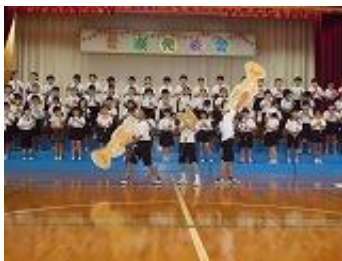
児童の発表の様子 左:6年生 右:3年生