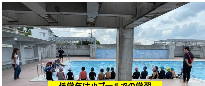
低学年は小プールでの学習

今年度は5月頃の水不足や6月の音楽発表会の実施などの諸事情を踏まえ、プールでの学習を夏休み明けからスタートしました。まだまだ暑い中で、元気いっぱいプールでの学習に取り組んでいる様子が見られます。各学年で、保護者の見守りにも協力いただき大変感謝しております。