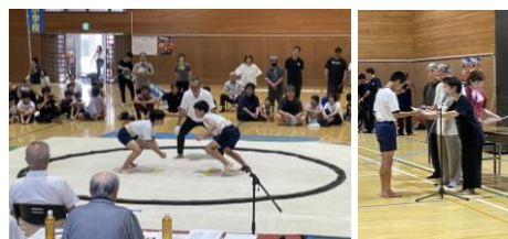
取り組み(左)と表彰式(右)の様子

<ちびっこ相撲大会> 7月20日(土)には首里振興会主催の『第29回ちびっこ相撲大会』が開催され、本校から4年生、6年生が参加し、それぞれの部門で第3位となり、表彰されました。