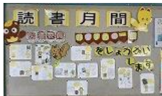
図書委員のおすすめ本