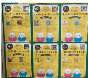
各学校の司書のおすすめ本