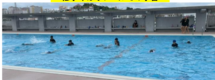
高学年は大プールでの学習