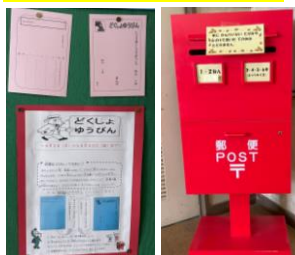
読書郵便の説明とポスト