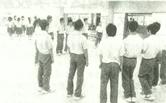
練習に取り組む2年3組（地域連携室）

ますが、保護者の皆様方にも是非お聴きいただき、子ども達の頑張りを激励していただきたいと思