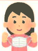
マスクの内側に 触れない