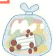
ビニール袋に入れて 密閉する