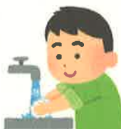
マスクを捨てた後は 手を洗う