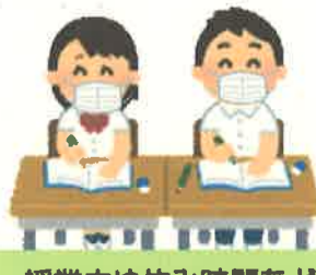
授業中や休み時間など 校舎内で過ごす時