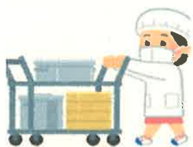
給食準備・片付け