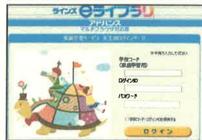
【先生用ログインページの画面】

ここをクリックして、直接 https://katei.kodomo.ne.jp と入力して検索すると、先程と同じページが開きます。よく似たページで、この画面 (先生用ログインページ) が開いたときには、家庭学習はできないのでご注意ください!