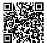
ツイタもんQRコード