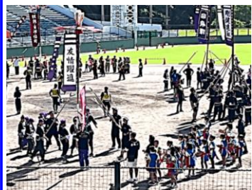
左手前の旗頭隊 右手前のチンク隊

10/1(日)セルラースタジアム那覇で那覇市内小中学校が参加する旗頭フェスタがありました。本校では、夏休み明け9月に入り、週に2回、地域の方々の指導の下、旗頭隊とチンク隊と一緒に練習に取り組みました。始めの頃は旗頭を持ち上げることも心配だった子も、本番では力強く見事に持ち上げていました。この底力は、チンク隊の太鼓の音と、元気がかけ声のおかげです。神原っ子の旗頭隊とチンク隊の音とかけ声は一際会場に響き、輝いていました。素晴らしいかったです。感動しました。