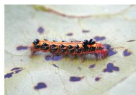
写真2.台湾キドクガの幼虫(2)

台湾キドクガの幼虫は体表に毒針毛(どくしんもう・写真3)とよばれる0.1mmほどの目に見えない毛が無数にあり、幼虫に直接触れたり、風で飛んできた毒針毛に接触することで毒蛾皮膚炎を発症します(写真4)。