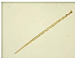
写真3.台湾キドクガの毒針毛

台湾キドクガの幼虫は体表に毒針毛(どくしんもう・写真3)とよばれる0.1mmほどの目に見えない毛が無数にあり、幼虫に直接触れたり、風で飛んできた毒針毛に接触することで毒蛾皮膚炎を発症します(写真4)。