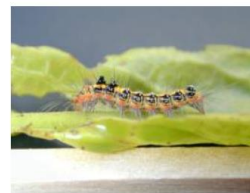
写真1.台湾キドクガの幼虫

台湾キドクガの幼虫は大きくなって2cm程度で、背中のオレンジ色の線と黒いコブが特徴(写真1、2)です。雑食性ですが、クワディーサー(モモタマナ、コバテイシ)の葉で多く見られます。