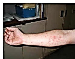
写真4.ほっしんの様子

※本件の 予防・応急処置 の詳細は11/16(木)保健室から発行のお手紙「台湾キドクガにご注意」をご覧ください。