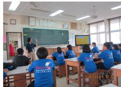
2組 4時間目 家庭科 波ぬいを使って刺しゅうをしよう