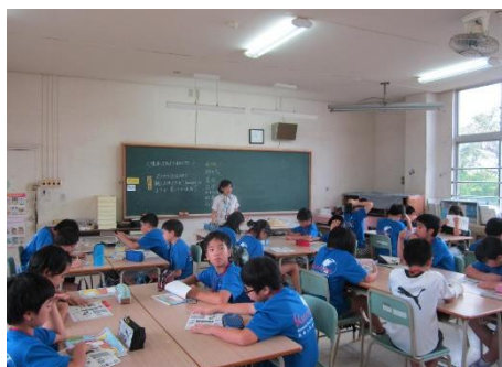
1組 3時間目 美術 「味わってみよう和の形」