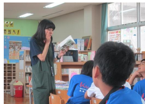
1組 4時間目 図書館教育 私たちは虫を食べてるんだって。