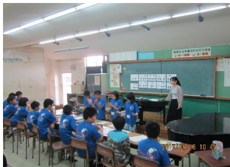
2組 2時間目 音楽 「自分だけのリズムを作り、クラスのみならずとポディーパークッションアンサンブルをしよう」