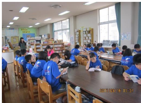
2組 3時間目 図書館教育 怖い話がたくさんあって面白そう。空想読本を読んでみたいな。