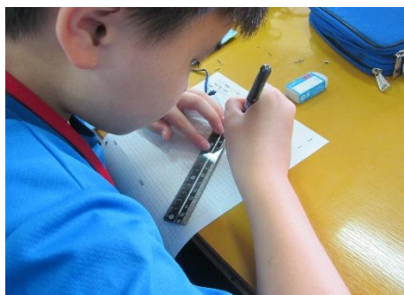
1組 2時間目 技術 「定規を使って正確に線を引く」