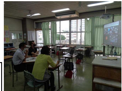
算数・数学班の皆さん

また、合同研修会では、授業改善部会、交流部会・特別支援交流班、生徒指導部会において、「ウィズコロナ時代」に対応する研修体制を整え、実施可能な取組内容を決定し、力強く歩み始めました。