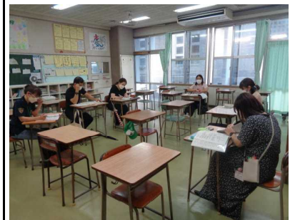
特別活動班の皆さん