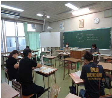
特別支援班の皆さん