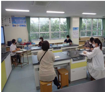
交流部会の皆さん