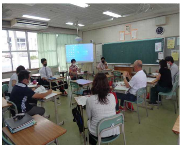
生徒指導部会の皆さん

前年度の成果と課題を共有し、今年度の取組について話し合う、第1回小中合同研修会が5月13日、神原中において行われました。