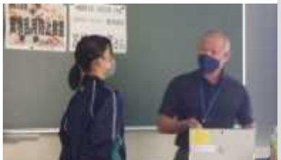
10/21 薬物乱用防止教室