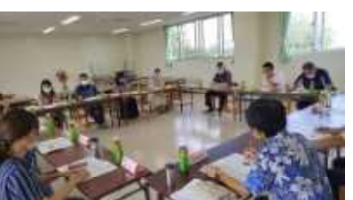
10/27 学校保健安全委員会