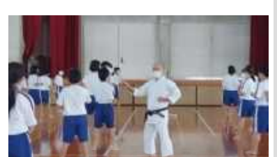
10/20 ~ 空手教室