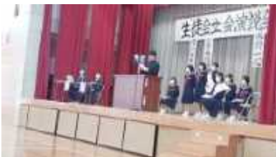
12/2 生徒会立ち会い演説会