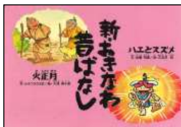
『新・おきなわ昔ばなし』