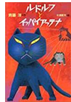
『ルドルフとイッパイアッテナ』 斉藤 洋/作