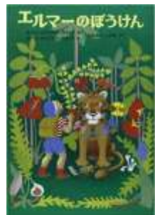
『エルマーのぼうけん』