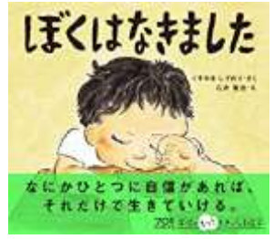
『ぼくはなきました』 くすのき しげのり/さく