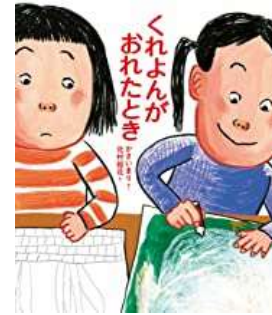
『くれよんがおれたとき』 かさい まり/さく