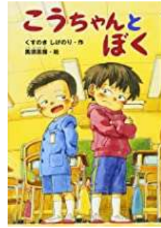
『こうちゃんとぼく』 くすのき しげのり/さく