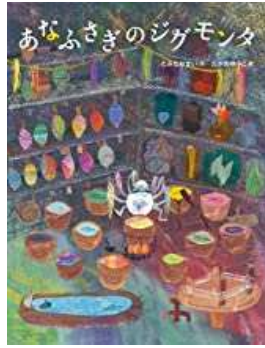
『あなふさぎのジグモンタ』