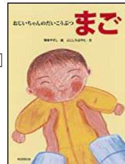
『おじいちゃんのだいこうぶつ まご』 池上 彰/さく