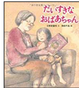
『だいすきなおばあちゃん』 日野原 重明/作