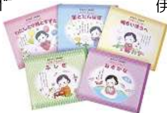
『金子みすゞ詩の絵本』