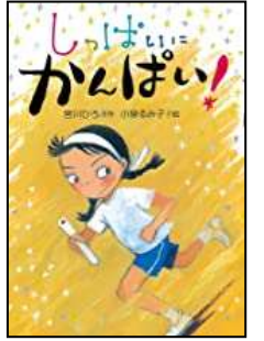
『しっばいにかんばい!』 みやがわ ひろ/さく