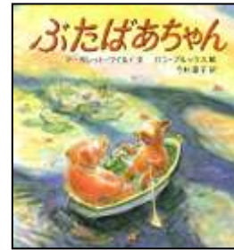
『ぶたばあちゃん』 マーガレット・わいんど/作