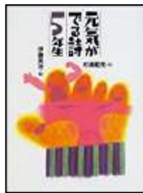
『元気ができる詩5年生』 伊藤 英治/作