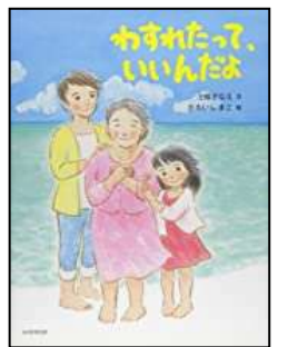
『わすれたって、いいんだよ』 上條 さなえ/作

1・2ねんせいの おすすめの本は えほんコーナー 3～6年生のおすすめの本は小説のたなの上にあるよ!