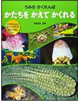
『うみのかくれんぼシリーズ』 ただだ まさみち/さく

ねんせい 1年生【うみの生きものずかんをよもう】 【かんそう文・かんそうがをかこう】