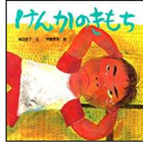
『けんかのきもち』 しばた あいこ/さく