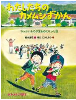
『わたしたちのカメムシずかん』