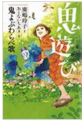
『鬼遊び』 廣嶋玲子/作