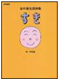
『谷川俊太郎詩集 すき』 谷川 俊太郎/作