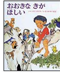
『おおきな きが ほしい』 さとう さとる/さく