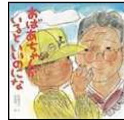
『おばあちゃんがいるといいのにな』 まつだ もとこ/作