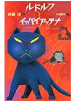
『ルドルフとイッパイアッテナ』 斉藤 洋/作