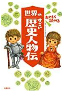
『世界のすごい歴史人物伝』