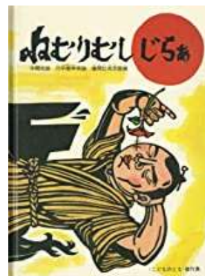
『沖縄のむかしばなし』 宮沢 貞子/作