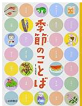
『季節のことば』 中村 和弘/作