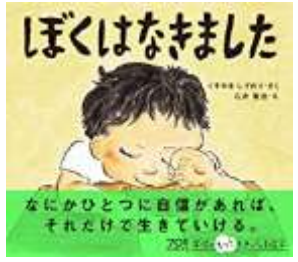
『ぼくはなきました』 くすのき しげのり/さく