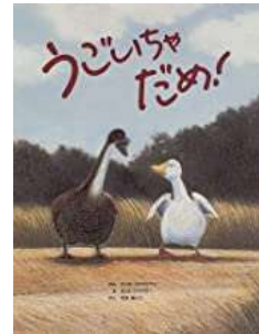
『うごいちゃだめ!』 エリカ=シルヴァマン/作