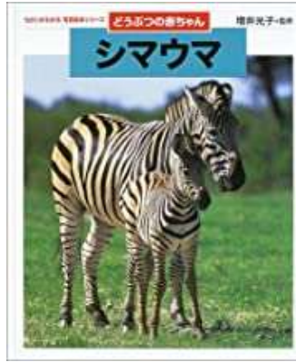
『ちがいがわかる写真絵本 どうぶつのあかちゃん』