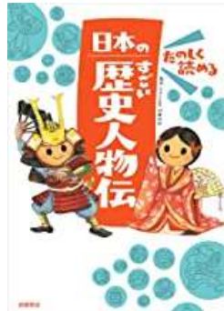
『日本のすごい歴史人物伝』