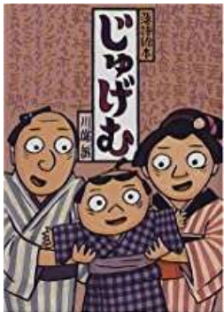
『落語絵本シリーズ』