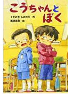
『こうちゃんとぼく』 くすのき しげのり/さく