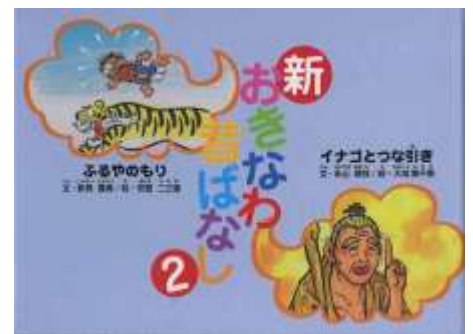
『新 おきなわ昔ばなし』