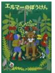
『エルマーのぼうけん』