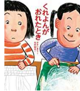
『くれよんがおれたとき』 かさい まり/さく