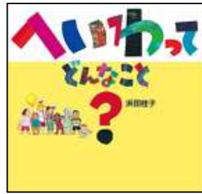
『へいわって どんなこと?』