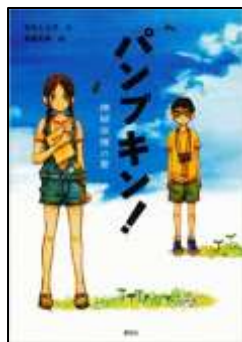
『パンプキン! 模擬原爆の夏』