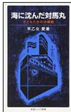
『海に沈んだ 対馬丸』