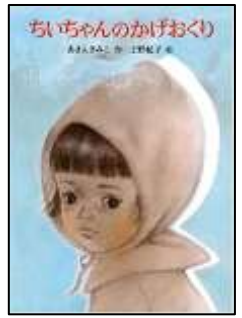
『ちいちゃんのかげおくり』