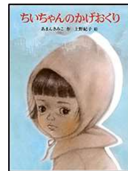
『ちいちゃんのかげおくり』