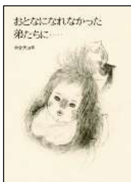
『おとなになれなかった弟たちに』