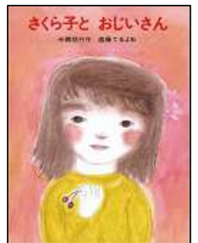
『さくら子と おじいさん』