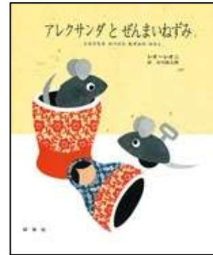
『アレクサンダとぜんまいねずみ』