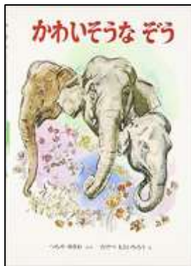
『かわいそうなぞう』