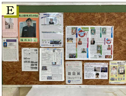
D：県内外高校・職業生徒募集ポスター（上段） 3年進路学習の流れ 職業の種類（下段） E：県内外学校便り（高校情報）