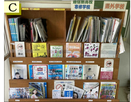
A：県立・私立高校、国立高専のパムフレット B：県内通信制・専修学校、県外高校のパムフレット C：進路に係わる雑誌等（下段）