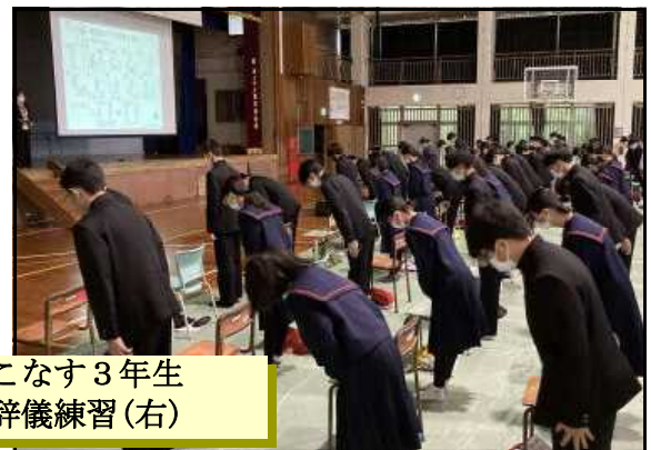
真剣に実技演習をこなす3年生 歩行練習(左)・お辞儀練習(右)