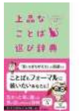
上品なことば選び辞典