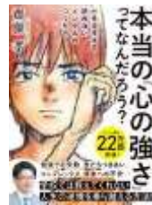
本当の心の強さってなんだろう？