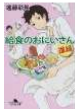
給食のおにいさん5