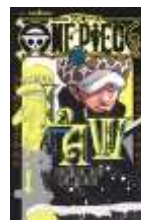
ONE PIECE LAW