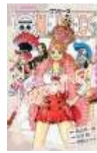
ONE PIECE HEROINES