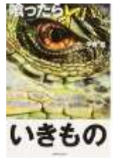
喰ったらヤバいいきもの