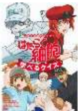
はたらく細胞学べるクイズ