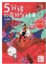
5分後に死ねばいい 心震える赤の巻