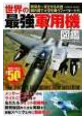
世界の最強軍用機