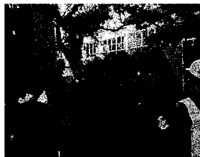
終了後、合同ミーティング♪