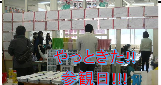
やっときた!! 参観日!!!

★1月6日、書き初め会が実施されました。1・2年生は教室で硬筆を、3年生から6年生は、体育館で毛筆をおこないました。子ども達は、手本の文字を、じっとみつめ、息を凝らして、書きあげました。一文字一文字に全集中する緊張感から、新年をむかえての、抱負、決意が伝わってくるようでした。今年こそ、新型コロナを卒業し、自由にのびのびと活動できる毎日が帰ってきますように・・・。