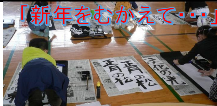
「新年をむかえて・・・」

★1月6日、書き初め会が実施されました。1・2年生は教室で硬筆を、3年生から6年生は、体育館で毛筆をおこないました。子ども達は、手本の文字を、じっとみつめ、息を凝らして、書きあげました。一文字一文字に全集中する緊張感から、新年をむかえての、抱負、決意が伝わってくるようでした。今年こそ、新型コロナを卒業し、自由にのびのびと活動できる毎日が帰ってきますように・・・。