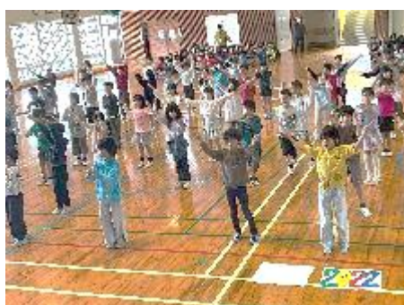
2年生の元気なダンス