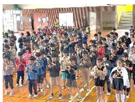
3年生のリコーダー演奏