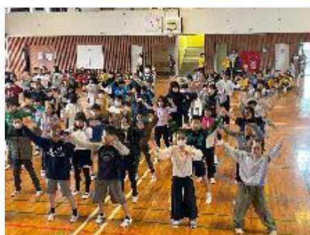
4年生のダンスと合唱