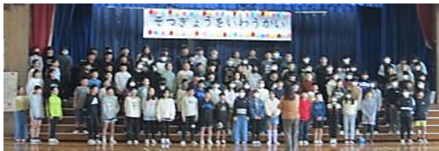
6年生による大合唱「明日へ」