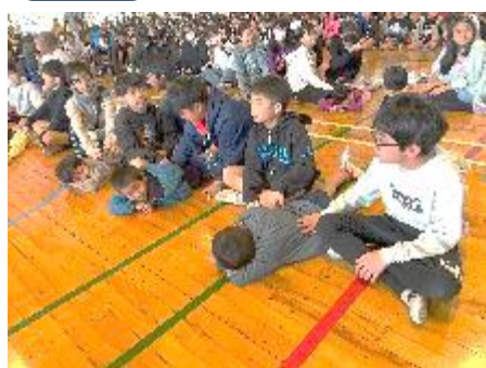
1年生と6年生 「おいものてんぷら」