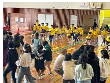
5年生 対 6年生; 五色つなひき! 迫力満点!