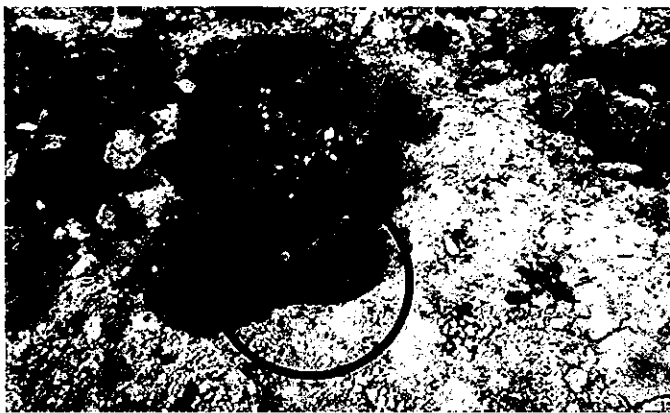
※発見された不発弾(米国製 5 インチ艦砲弾)