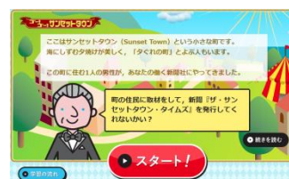
▲家庭での学習履歴が残ります