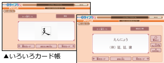
▲いろいろなカード帳

いろいろなカード帳やはやときチャレンジなど、楽しみながら学習するコンテンツもあります