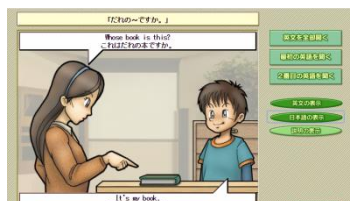
▲英文ごとに繰り返し聞けます