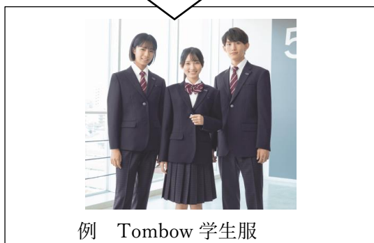
例 Tombow 学生服