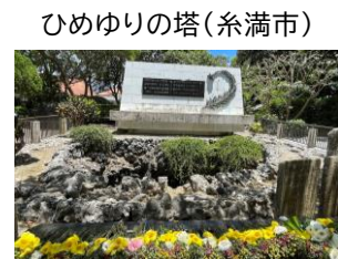
ひめゆりの塔(糸満市)