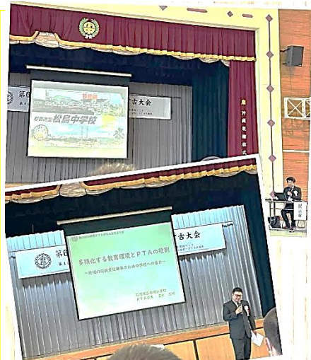
※松島中学校と石垣小学校の提言の様子

参加してみて思った私の解釈としては、ざっくりですが、お互いのPTA活動を知ることとで刺激をもらい、学び合うことが出来る、そんな会です。PTAって、学校に当たり前にあつて、自然と活動が行われていて、身近にあつて何となく知ってるけどイマイチ中身が見えてこない、、、って事ありませんか？私自身はあります。結構規模が大きいですよ、組織なので、がつり中に入らなくて本質が見えてこないといえますか、知ろうとしない、理解ができない。親も勉強が必要なんだなと感じました。(↑これを言いたいが為に長くなりました)大人がPTA活動への理解を深める事により、子ども達へ、より良いサポートが実現できるのかもしれない。