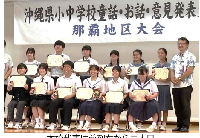
本校代表は前列右から二人目