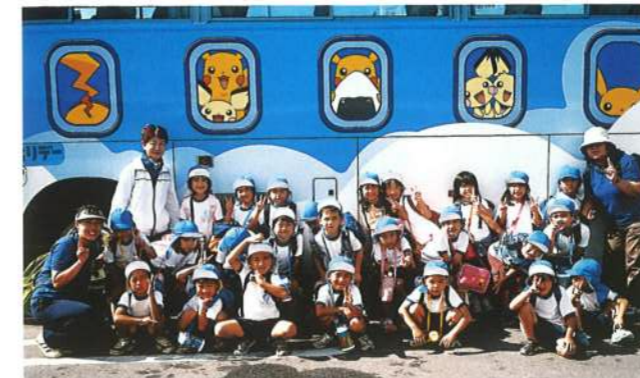
ピカチュウのバスに乗って、今日は楽しい遠足です。(平成18年)

小学校に入る前の1年間はとても短いけれど、友だちを作り、社会生活を体験し、ぐんぐん成長していく子どもたちの姿は頼もしささえ感じます。