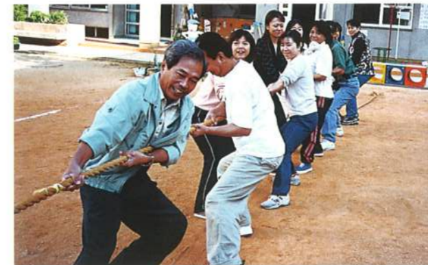
親子ミニ運動会の綱引き。がんばれお父さん、がんばれお母さん。(平成12年11月)