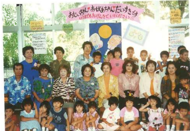
大好きなおじいちゃん、おばあちゃんを幼稚園にお招きしました。(平成13年)