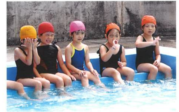
プールで水遊び。冷たい水は気持ちいい〜!(平成15年)