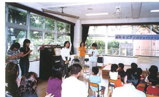
日曜参観で、「絵本とピアノのジョイントコンサート」を行いました。お父さんもたくさん参加してくれましたよ。(平成17年6月)