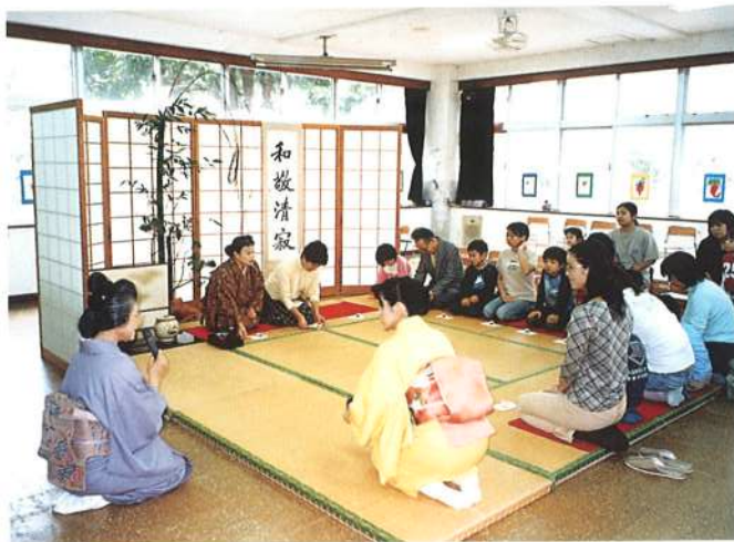
幼稚園のフロアに畳を敷いて、お茶席を作りました。正座をして、神妙な顔つきでお茶をいただきました。お味はいかが？(平成18年1月)