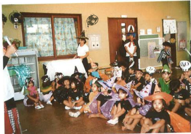
ハロウィンの仮装で、かわいいどくろや魔法使いがたくさん現れたよ。(平成12年)