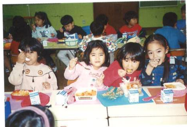
お弁当の日。大好きなおかず、入っているかな?