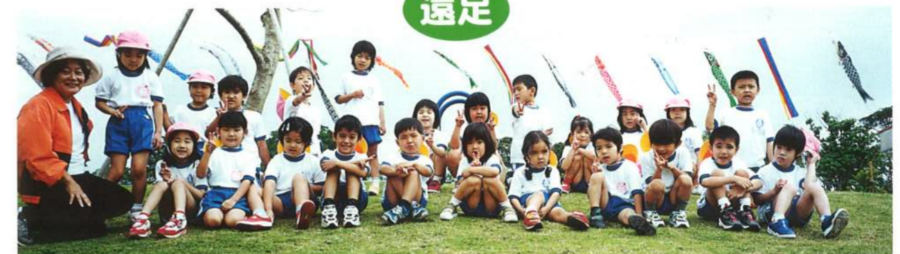
春の遠足。グスクロード公園にて(平成13年)