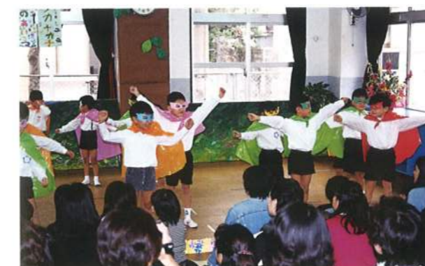
ビービー仮面参上!(平成9年)