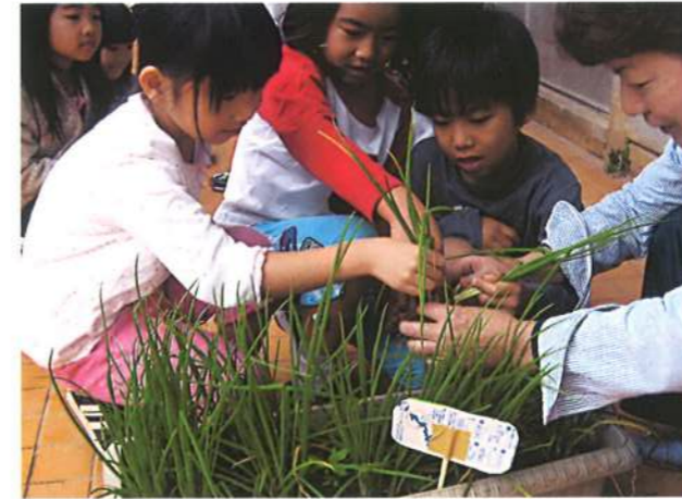
みんなで育てたネギを収穫しました。どんなお料理にしようかな?(平成19年)