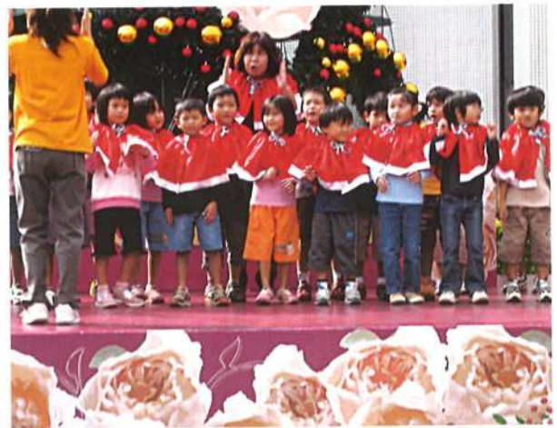
那覇市生涯フェスティバルでは合唱を披露。(平成17年11月)