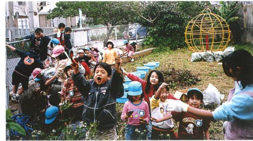
園庭で育てたお芋を掘りました。(平成15年)