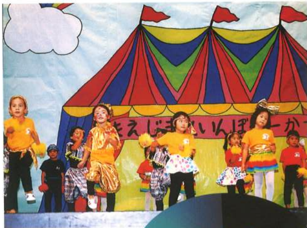
「前島レインボーサーカス」で那覇市公立幼稚園の代表として全国生涯フェスティバルに参加しました。(平成15年11月)

その道を極めたスペシャリストの指導を受けて、子どもたちは素晴らしい表現力を学び、本物の輝きを身をもって感じます。生きるヒント、学ぶきっかけの小さなタネが心の中で育ちはじめました。