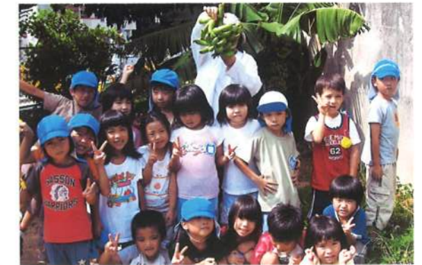
みんなで記念写真。バナナで顔を隠しているのは誰かな?(平成18年)