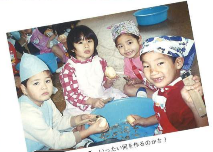
じゃがいもの皮をむいて、いったい何を作るのかな?