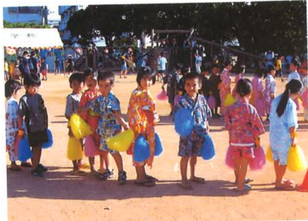
夏祭り。かわいい浴衣姿で踊ります。(平成18年7月)