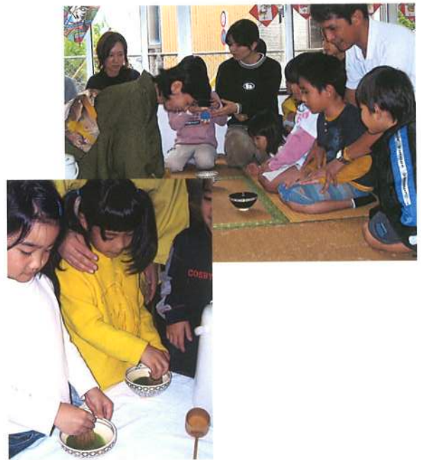
自分でもお茶をたててみよう。