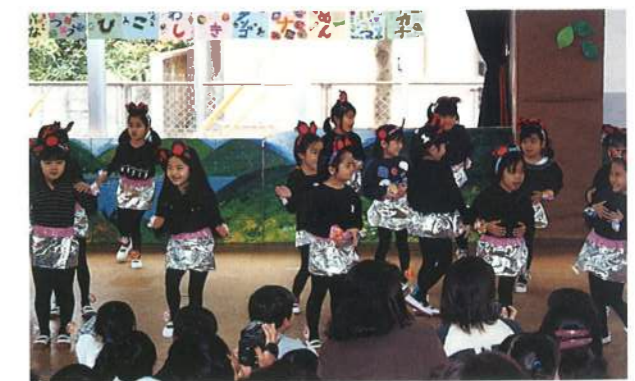
チャームな踊りはいかが?(平成9年)