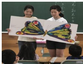
1年生へよみかかせをしています。