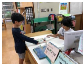
本の貸出をしている様子

6年生10名で、1年間みなさんの本を借りる お手伝いをします。みなさんもお協力お願いします。