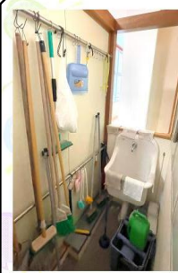
3年トイレの そうじ道具置き場