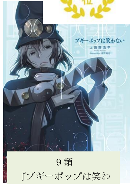
9類 『ブギーポップは笑わ ない』 97票