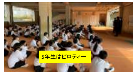
5年生はピロティー