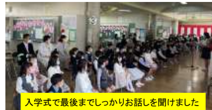
入学式で最後までしっかりお話を聞けました