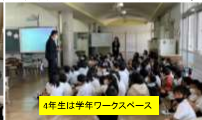
4年生は学年ワークスペース