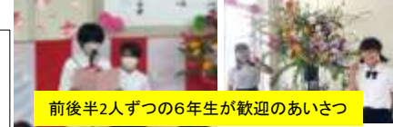
前後半2人ずつの6年生が歓迎のあいさつ

学校だより「はぐくみ」で学校行事や学校生活の様子をお届けしていく予定です。学校からのお知らせや行事予定等をお知らせする「識名小通信」と併せて発行していきます。