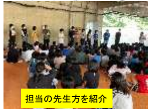
担当の先生方を紹介

4月12日令和4年度の委員会活動発足式が行われました。素直元気・頼れる6年生が決意を新たに活動していきます。日常の活動に加え創意工夫した活動にの期待しています。