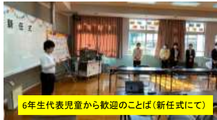
6年生代表児童から歓迎のこぼ（新任式にて）