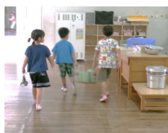
力を合わせて給食当番