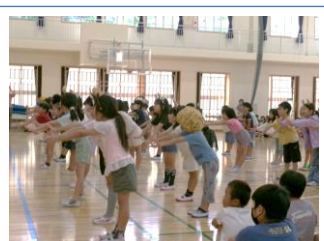
元気いっぱい2年生のダンス