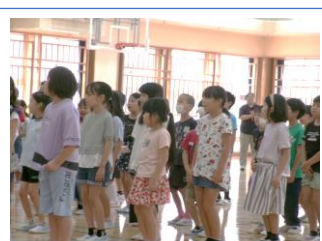
3年生「おむすびころりん」♪