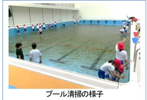
プール清掃の様子

そして下校時には、本校で初めての「災害時引き渡し訓練」を行いました。万が一に備え、これからも子ども達の安心・安全を確保するための取り組みを行っていきたくと考えています。皆様のご理解ご協力をよろしくお願いいたします。