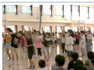
5年生のクイズとダンス