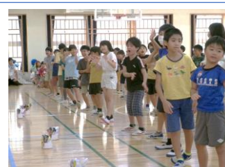
4年生のダンス&プレゼント