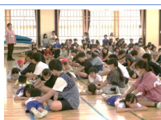
6年生「おもいの天ぷら」