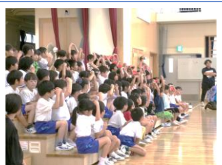
クイズに答える1年生

みんなで思いっきり楽しみ、話を聞く場面ではしっかり聞くことができるメリハリのある識名っ子。これからも、自分たちの学校を自分たちでよりよくしていくために、工夫して取り組んでほしいと思います。