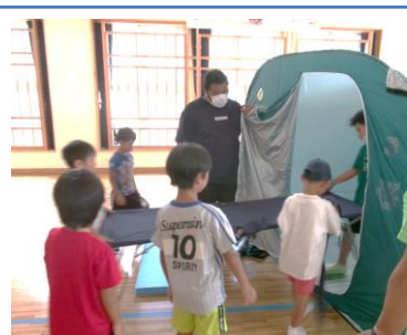
簡易ベッドを運び込む