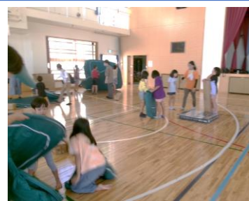
テント設営の様子