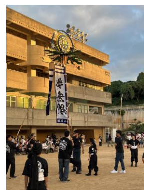
繁多川まつりにて