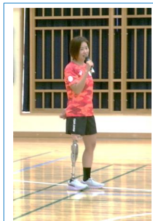
秦 由加子 選手

10月10日に、パラアスリートの秦 由加子選手を本校へお招きし、「『自分次第で人生は変わる』～どんなことがあっても前へ続く道がある～」の演題で、4～6年生にご講話をしていただきました。秦選手は、今年パリで開催