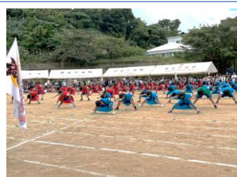
識名魂ソーラン節