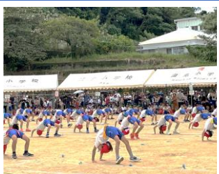
心をひとつに最高到達点へ Jump

ご家族や地域の皆様も多数ご来校頂き、本当にありがとうございました。運動会を通して子ども達は、また一つ成長したように感じます。これからも、識名っ子を共に見守り支えて頂きますようお願いいたします。