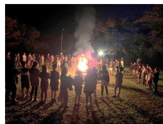
キャンプファイヤー!