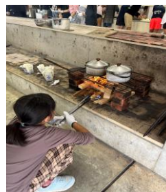
火起こしも頑張りました