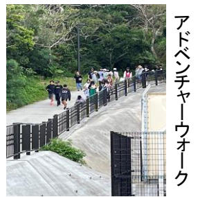
アドベンチャーウォーク

自然教室で学んだことを生かし、高学年として下級生をリードして行ってほしいと思います。5年生の活躍に期待しています!