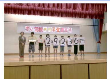
募金贈呈式の様子