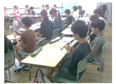
♪ リコーダーの練習

今年も、識名っ子の成長を共に見守り支えて頂きますよう、どうぞよろしくお願いいたします。