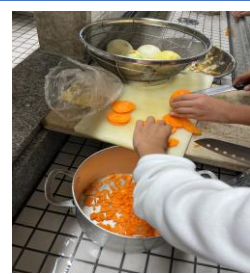
カレー作りの様子