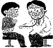
まんまる子どもクリニック よなは歯科クリニック