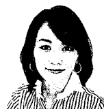
フリーアナウンサー 木佐 彩子