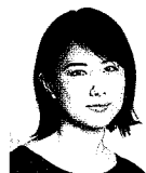
女優・作家・歌手 中江 有里