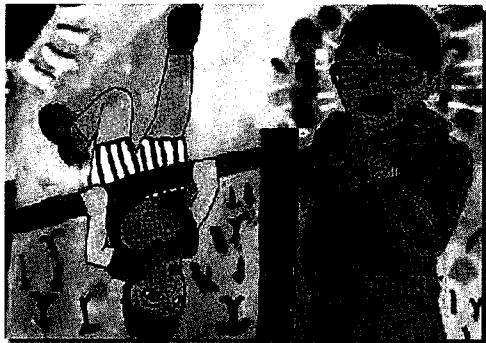
【一緒にがんばれる!】

今年度は県内小・中・高・特別支援学校をあわせて 840点の応募がありました。 たくさんのご応募ありがとうございました。