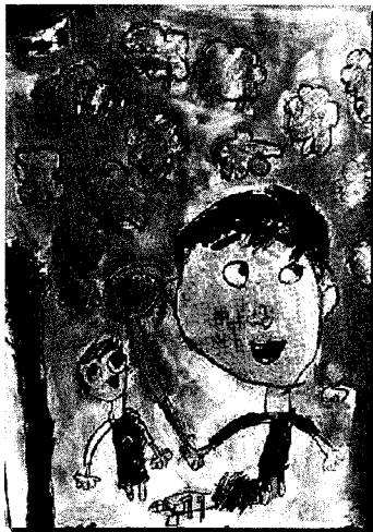
【かぞへんがくをいっしょにやろう】