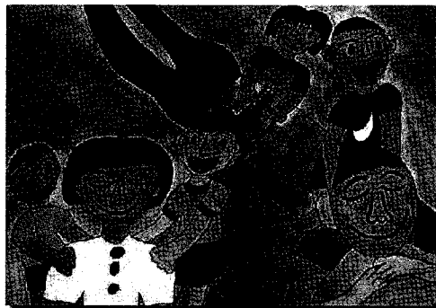
【ありがとう いつも仕事おつかれ様】