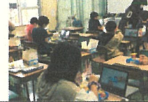
理科では、設計図と設計の動画で確認しながら、電池で動く自動車づくりをしています。

CIGAスクール構想により、市内小中学校にタブレットが配布され、一年が経過しましたが、本校でも教科指導等でタブレットを活用しております。 今年度もICT支援員とも連携しながら、授業づくり等、学年の発達段階に応じて子ども達のICT活用能力の育成を図りたいと考えております。