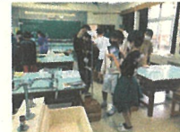
実験の様子をタブレットで撮影しています。動画で実験の様子を繰り返し確認できます。