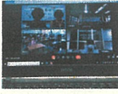
オンラインで読み聞かせ