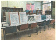
平和に関する本やパネルの展示